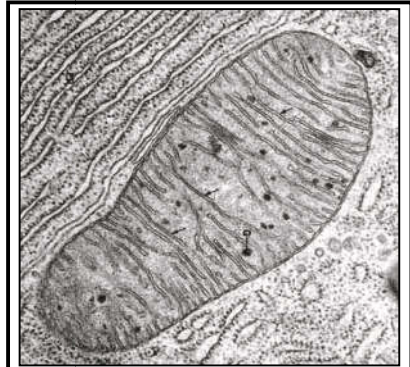
(أ) صورة إلكتروغرافية للميتوكوندري