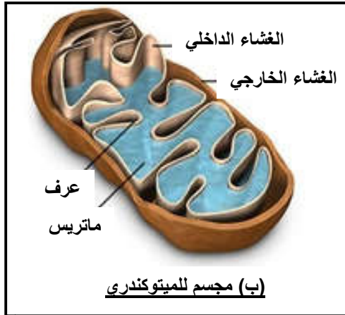
(ب) مجسم للميتوكوندري