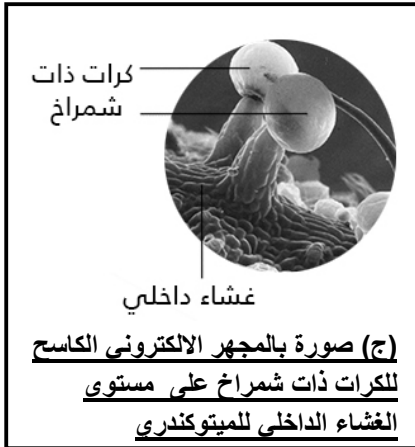
كرات ذات شمراخ